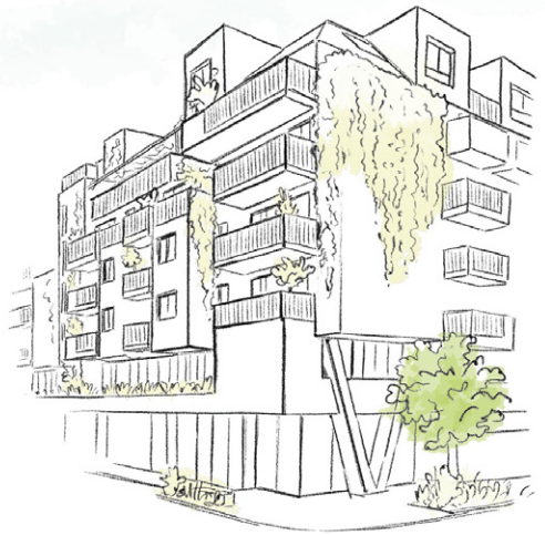
Mehrfach ausgezeichnetes Projekt: G'mischter Block in Wien

Auszeichnungen wie die klimaaktiv Bronze-Plakette für STADT.LAND.KUSS. sind eine willkommene Bestätigung, dass dieser Kurs stimmt. Grundlage für die Auszeichnung war ein entscheidender Qualitätssprung bei Umweltfreundlichkeit und Wohnkomfort. Mit einer Zusatzinvestition von nur rund 50.000 Euro wurden signifikante Einsparungen erreicht, die nicht nur der Umwelt, sondern auch der Geldbörse der neuen Eigentümer zugute kommen. So wurde der Heizwärmebedarf von 33,8 auf 28,8 kWh/m 2 a gesenkt, wodurch pro Jahr etwa 2.000 kWh Energie eingespart werden. Parallel dazu wurden auch die CO 2 -Emissionen von 9,48 auf 8,3 kg/m 2 a gesenkt, wodurch jährlich mehr als eine Tonne weniger CO 2 ausgestoßen wird. Der Gesamtenergieeffizienzfaktor verbesserte sich von 0,816 auf 0,63. Verantwortlich dafür ist ein nachhaltiges Maßnahmenbündel, das etwa die Energieversorgung über eine Photovoltaik-Anlage, eine Grundwasser-Wärmepumpe mit hohem Wirkungsgrad sowie innovative Ziegel mit integrierter Wärmedämmung umfasst.