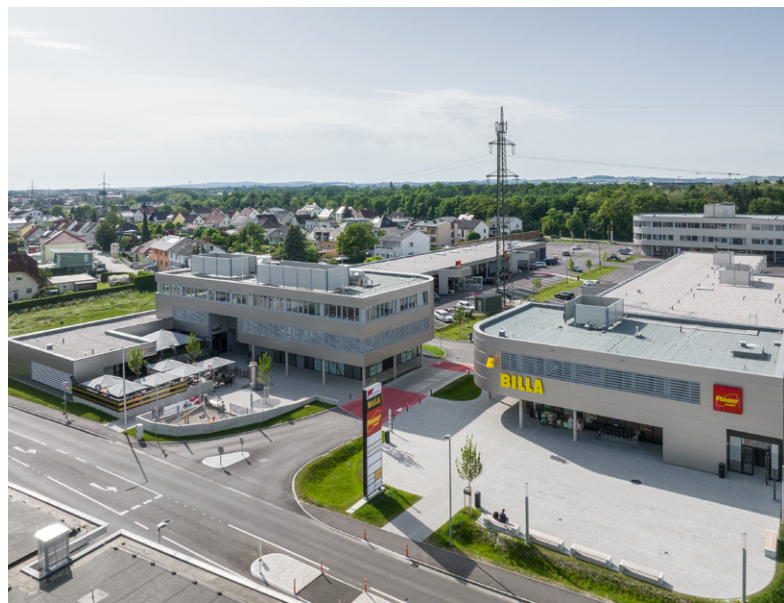
Stadtteilzentrum STZ Weidfeld in Traun

Architektur, Finanzierung, Errichtung, Projektsteuerung und Vertrieb konzentrieren“, umreißt Wiesinger die Eckpfeiler einer Zusammenarbeit, die zur Partnerschaft wurde.